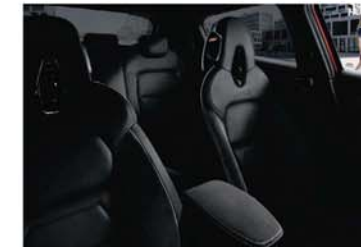
N-DESIGN PAKET „CHIC“ – BLACK Teillederpolsterung mit Alcantara®-Einsätzen in Enigma Black