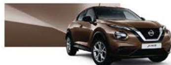
Bronze (M) – CAN