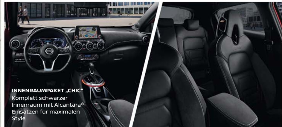
INNENRAUMPAKET „CHIC“ Komplett schwarzer Innenraum mit Alcantara®-Einsätzen für maximalen Style