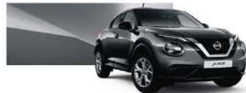
Dark Grey (M) – KAD