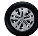
16"-Stahlfelgen mit Radabdeckung