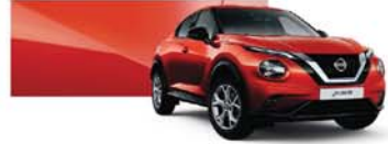
Fuji Sunset Red (M) – NBV