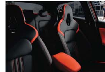
N-DESIGN PAKET „ACTIVE“ – ORANGE Teillederpolsterung mit synthetischen Ledereinsätzen in Energy Orange