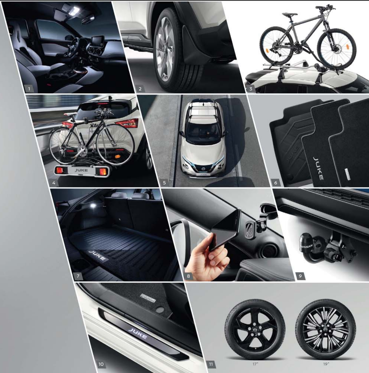
17"-LEICHTMETALL-FELGE MIT NABENKAPPE