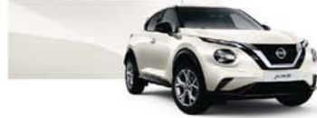
Pearl White (P) – QAB