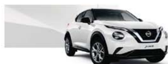
Solid White (S) – 326