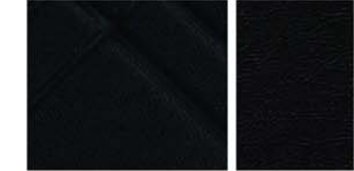
TEKNA STANDARD Synthetische Teilledersitze (Stoff / synthetische Leder-Kombination)