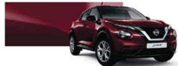
Burgundy (M) – NBQ