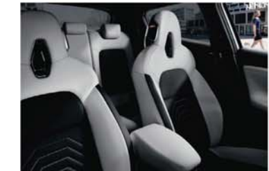
N-DESIGN PAKET „LIFESTYLE“ – WHITE Synthetische Teilledersitze (Stoff / synthetische Leder-Kombination) in Greyish White