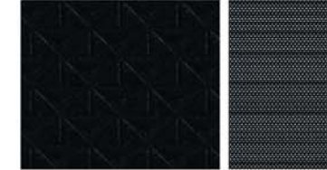
N-CONNECTA STANDARD Schwarzer geprägter Stoff / schwarzer Stoff