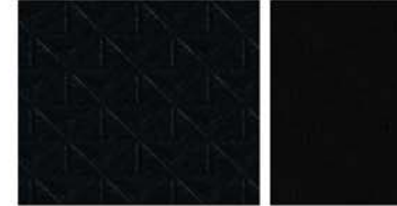
ACENTA & VISIA STANDARD Schwarzer geprägter Stoff / schwarzer Stoff