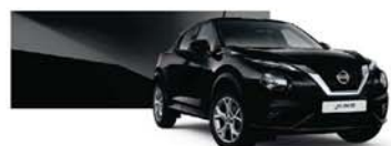
Black (M) – Z11