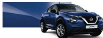
Ink Blue (M) – RBN