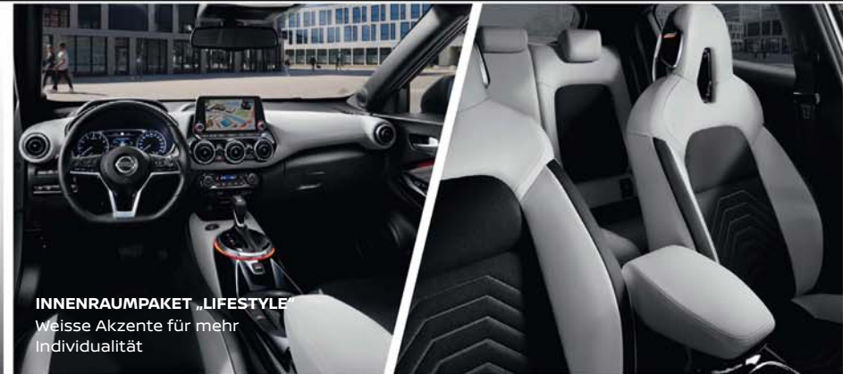
INNENRAUMPAKET „LIFESTYLE“ Weiße Akzente für mehr Individualität

Dank 15 Kombinationen der zweifarbigen Karosserielackierung können Sie sich wie nie zuvor ausdrücken. Noch individueller wird es mit den dazu passenden aufregenden Innenraumfarben.