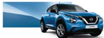
Vivid Blue (M) – RCA