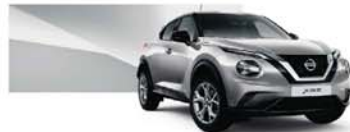
Silver (M) – KYO