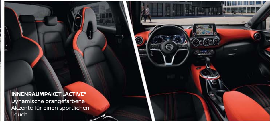
INNENRAUMPAKET „ACTIVE“ Dynamische orangefarbene Akzente für einen sportlichen Touch