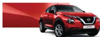
Solid Red (S) – Z10